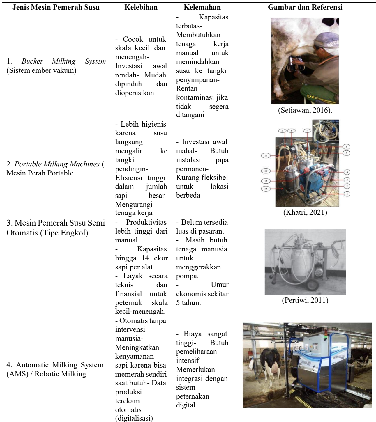
Tabel 1. Jenis Milking Machines